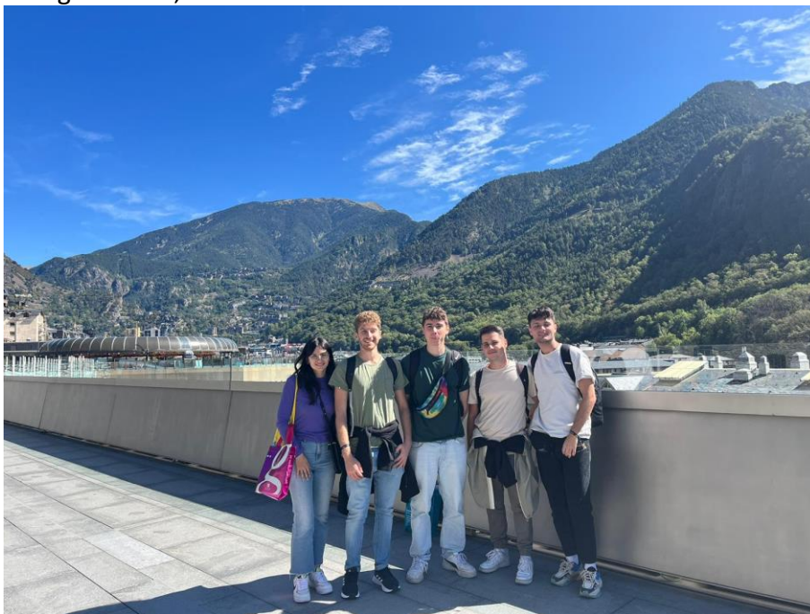
Ausflug nach Andorra

Zu Beginn wurden viele Veranstaltungen zum Kennenlernen anderer Studenten organisiert. Es ist sehr empfehlenswert, diese größtenteils zu besuchen, um schnell in Kontakt mit anderen zu kommen. Tatsächlich habe ich einen sehr großen Teil meiner späteren Freunde in der ersten Woche kennengelernt. Es kamen zwar noch weitere hinzu, aber die meisten kannte ich von den ersten Veranstaltungen. Insbesondere die Veranstaltungen vom Erasmus Student Network sind sehr zu empfehlen. Es gab Karaokeabende, Strandbesuche, Wanderungen usw. Später haben wir auch an Bustouren nach Andorra, Girona oder auch einem Wochenendaufenthalt auf Mallorca teilgenommen. Es gab also reichlich Gelegenheiten, sich mit anderen Erasmusstudenten zu vernetzen.